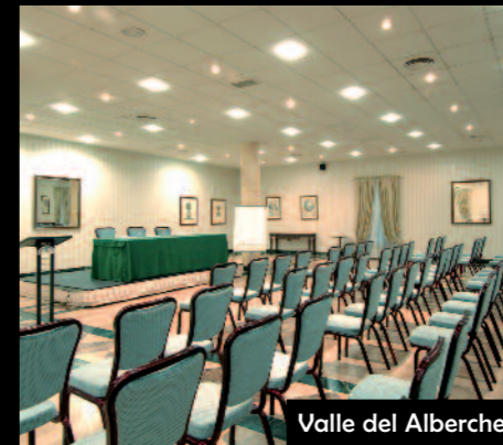
Valle del Alberche