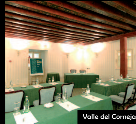
Valle del Corneja