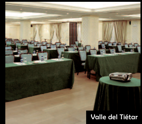
Valle del Tiétar